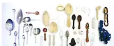
Delar av Laila Ribas Valls (CRAFT1 Ädelab) skeduppsättning "Å Taula!".

Och Laila Ribas Valls (CRAFT1 Ädelab) hade placerat ut handgjor- da skedar i olika storlekar, design och material över hela bordsytan. "Å Taula!" heter den läckra installation som sjuder av liv.