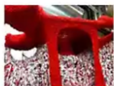
Evelina Kollberg (Textil) "Människofällan", detalj.

Evelina Kollbergs (Textil) "Människofällan" är den mest monumentala. En flera meter lång interaktiv skulptur, möjlig att krypa in i. Evelina Kollberg vill ta plats i rummet med hjälp av den kvinnliga hantverkstraditionen virkning.